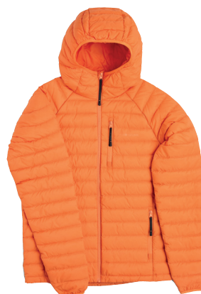
Missing Link Ultralett dunjakke ink. logobroderi kr 1.299,- Unisex + damestr. 3 fargevarianter.