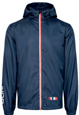
Nor Windbraker Foret. Inkl logoprint kr 499,- Unisex + damestr.