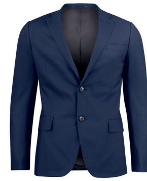
JH&F Classic blazer inkl. logobroderi fra kr 2.599,- Unisex + damestr. 4 fargevarianter. Matchende bukser.