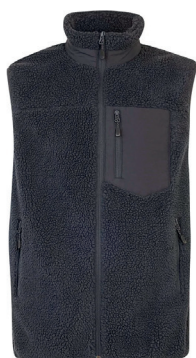
Tracker Pile Vest ink. logobroderi kr 749,-