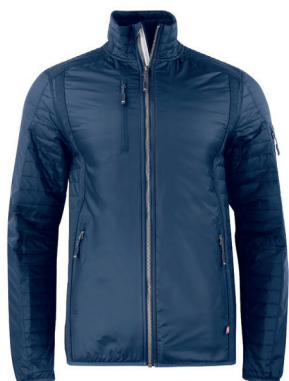
Cutter & Buck Lettvattert Primaloft jakke ink. logobroderi kr 1.659,- Unisex + damestr. 2 fargevarianter.