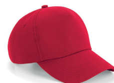
Beechfield Authentic 5 Panel Caps ink. logobroderi kr 179,- Unisex m/reguleringsstropp. Fargevarianter.