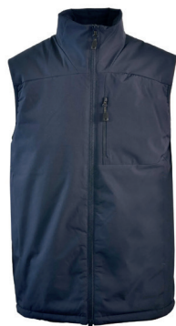
Tracker lettvatert helårsvest ink. logobroderi kr 799,-