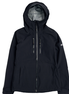
Missing Link 3l Skalljakke 10000/10000 ink. logoprint kr 1.399,- Unisex + damestr. 3 fargevarianter. Bukse tilgjengelig.