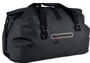
Tracker 55l vannett Duffelbag ink. logoprint kr 649,-

Carlo Cab København 3-pack ink. preget logo kr 3.798,- 7 fargevarianter.