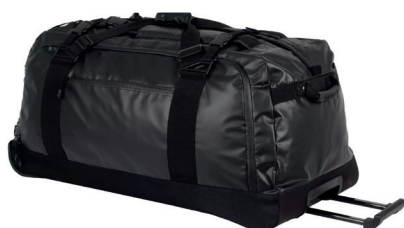
Tracker Explorer Rollerbag med 6 rom ink. logoprint kr 1.499,-