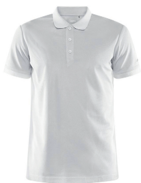
Craft Core Unify Tec Light & quickdry Pique ink. logobroderi kr 399,- Unisex + damestr, 16 fargevarianter.