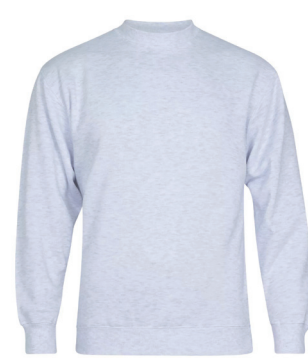
Tracker 280 gr. forkrympet 80/20 Bo/Po sweat ink. logobroderi kr 349,- Unisex. 9 fargevarianter.