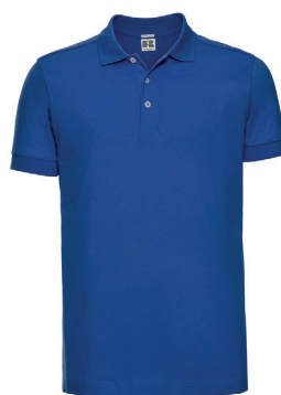
Russel Stretch 205 gr. premium Polo ink. logobroderi kr 399,- Unisex + damestr. 12 fargevarianter.