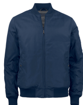
Cutter & Buck Flyverjakke MA-1, foret flyverjakke ink. logoprint kr 1.059,- Unisex + damestr. 2 fargevarianter.