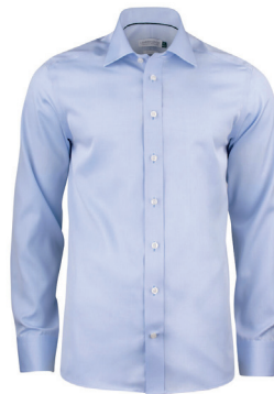
JH&F Green Bow strykefri skjorte inkl. logobroderi fra kr 799,- Slimfit, regular + damestr. 80 styles.