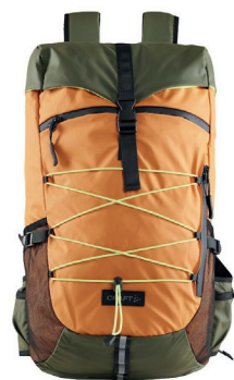
Craft 40l sekk ink. logobroderi kr 1.099,- 2 fargevarianter.