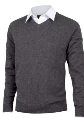
Tracker Pima Cotton V Genser ink. logobroderi kr 599,- Unisex. 4 fargevarianter.