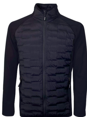
Tracker Hybridjakke ink. logobroderi kr 1.149,- Unisex + damestr.