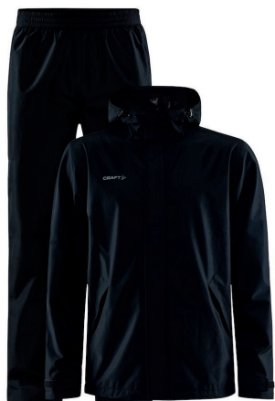
Craft Regndress 5000/5000 meshforet ink. logoprint kr 1.199,- Unisex + damestr.