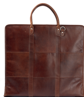
Dressbag i skinn ink. preget logo kr 2.099,-