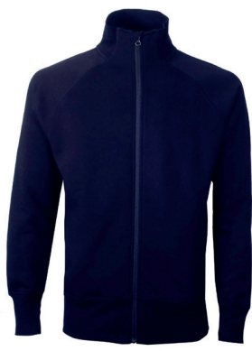
Tracker 280 gr. forkrympet 80/20 Bo/Po jakkesweat ink. logobroderi kr 499,- Unisex. 3 fargevarianter.