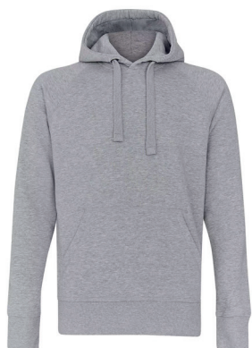
Tracker 280 gr. forkrympet 80/20 Bo/Po hood ink. logobroderi kr 429,- Unisex. 8 fargevarianter.