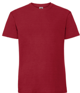
Fruit Icon 195 gr. Tee ink ensf. logoprint kr 129,- Ringspun kjemmet bomull. Unisex + damestr. 19 fargevarianter.