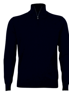
Tracker 1/4 Zip Pima Cotton Genser ink. logobroderi kr 749,- Unisex.